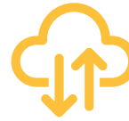
Internet / Cloud